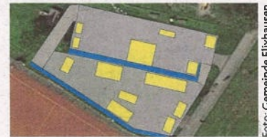
Der Plan für die neue Skateranlage in Elixhausen.

D amit Beruf und Familie gut vereinbar sind, setzt Elixhausen auf ein flexibles Modulsystem für die Betreuung. Dadurch ist es möglich, die Kinder auch tageweise unterschiedlich lang in der Betreuungseinrichtung anzumelden. Elixhausen hat überdies in den letzten drei Jahren drei zusätzliche Gruppen aufgesperrt und an die 300.000 Euro in entsprechende Aus- und Umbauten investiert. Besonders erfreulich ist für die Gemeinde, dass auch das entsprechende Personal dafür gefunden werden konnte. Investiert wurde in der letzten Zeit