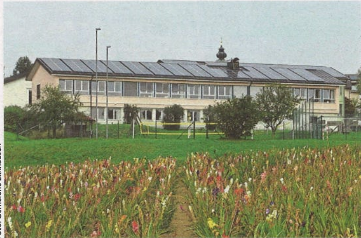
Die PV-Anlage auf dem Dach der VS Elixhausen