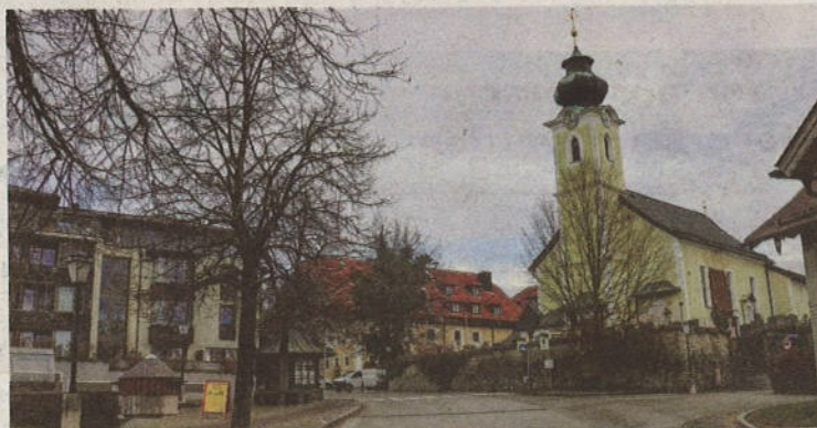
Dorfplatz und Dorfstraße sollen attraktiver gestaltet werden.

offener, barrierefreier und verkehrsberuhigt gestaltet werden. Mehr Grün und weitere belebende Elemente mit Wasser sowie zusätzliche Sitzgelegenheiten